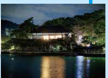
▲伊達家ゆかりの茶室で優雅にお月見

藩制時代と変わらぬ幻想的な夜の海を鑑賞 観瀾亭 夏の満月スペシャル 8月25日(土) 17:00~20:00 (入館は19:30まで)