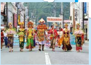
▲きらびやかな伝統衣装に身を包んだ一行が行進

港町を舞台に大いにぎわう真夏の祭典 気仙沼みなとまつり 8月4日(土)・5日(日)