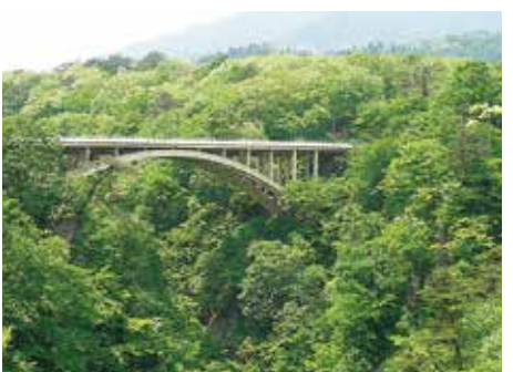
▲散策の起点となる「鳴子峡レストハウス」からの眺望

宮城県と山形県にまたがる東北の霊峰・蔵王連峰。その山頂には、刈田岳・熊野岳・五色岳の3峰に抱かれた円型の火口湖「御釜」があり、天候などの条件によってエメラルドグリーンや瑠璃色に変化する湖水をたたえています。また、宮城県と山形県を結ぶ山岳観光道路「蔵王エコーライン」では、車窓から火山岩むき出しのダイナミックな景色、沿道に茂るブナやナラののみずみずしいグリーンなど、雄大な自然の息吹を感じるドライブが楽しめます。三階滝と不動滝が眺望できる「滝見台」も、涼味満点のスポットです。