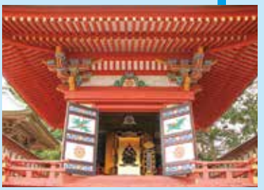
▲県の指定文化財となっている「成実霊屋」

亙理の礎を築いた名君をしのんで参拝 伊達成実霊屋御開帳 8月16日(木) 8:30~16:30