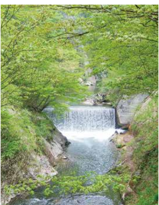
▲四季折々に違った美しさに出合える「鳴子峡」